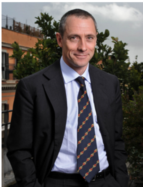
Matteo Del Fante