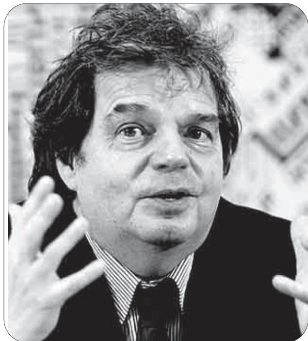
Il ministro per la Pubblica Amministrazione e l'Innovazione, Renato Brunetta

Come affrontare, perciò, la competizione ed i cambiamenti strutturali e cosa rispondere sul fronte lavoro - o meglio: offerta di lavoro - sia nel settore