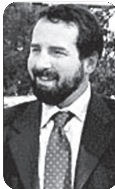
Il prof. Paolo Zocchi

Dal 2006 al 2008 è stato Consigliere per l'Innovazione del Ministro per gli Affari Regionali e le Autonomie Locali e membro della Commissione Permanente per l'Innovazione Tecnologica negli Enti Locali e nelle Regioni e, come Dirigente di prima fascia della Presidenza del Consiglio dei Ministri. Inoltre è stato Direttore della struttura di missione PORE VALORE LOCALE con il compito di supportare gli enti locali e le Regioni nell'accesso ai fondi tematici dell'UE e nello sviluppo di azione legate all'innovazione tecnologica. Nell'ambito di queste attività è stato membro dei alcuni importanti organismi istituzionali, quali: