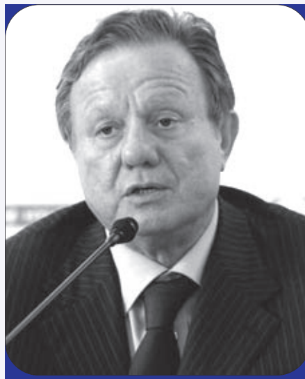
on. Altero Matteoli Ministro delle Infrastrutture e Trasporti

Un esempio classico è il grande lavoro dei tanti, tantissimi amministratori locali della Provincia di Napoli, ma con scarsi risultati perché alla fine, prima o poi, esce il pierino di turno, che ti fa sprofondare nell'abisso con lo scioglimento del Consiglio comunale per infiltrazione camorristica e purtroppo ciò è avvenuto per la