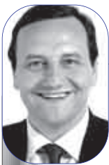
L'ex ministro F.P. Baccini