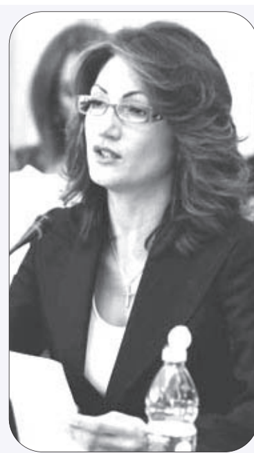
I ministro Maria Stella Gelmini

2a) Per quanto attiene al profilo della docenza, sia la reintroduzione dell'insegnante unico che la riduzione dell'orario scolastico comportano innanzi tutto un danno enorme di natura pedagogica; da oltre 20 anni, infatti, la scuola elementare vede la presenza in ogni classe