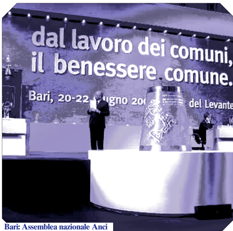
Bari: Assemblea nazionale Anci

"L'applicazione dei principi derivanti dalla medesima disciplina, opportunamente dettagliati in norme regolamentari da parte delle Autonomie locali, consente di garantire non solo la necessaria continuità del servizio - conclude Rughetti - ma anche il pieno rispetto del principio costituzionale di non discriminazione fra gli alunni di scuole statali e gli alunni di scuole paritarie". (fr)