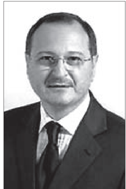
Il Sen. Salvo Fleres

Nel 1995 è stato istituito in Ungheria l'Ufficio dell'Ombudsman parlamentare che può ricevere reclami di detenuti ed effettuare visite ispettive di controllo nelle carceri.